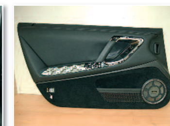
Voici le panneau de porte démonté.