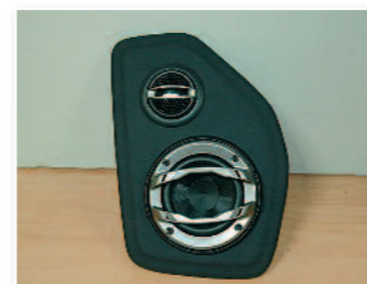
Fixation du médium aigus sur le support...