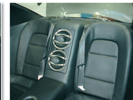
Remontage total de l'arrière : on dirait que rien n'a changé, ou presque... et pourtant !