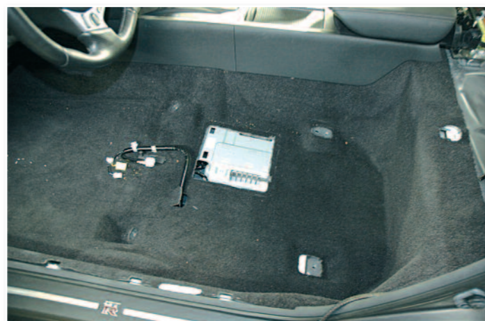
On commence par le démontage du siège conducteur.