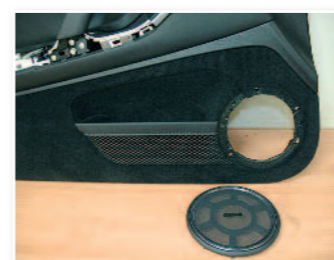
Démontage des grilles d'origine.