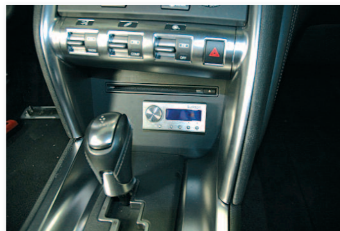
Comme si ça place lui était réservée, le voici sur la console remontée !