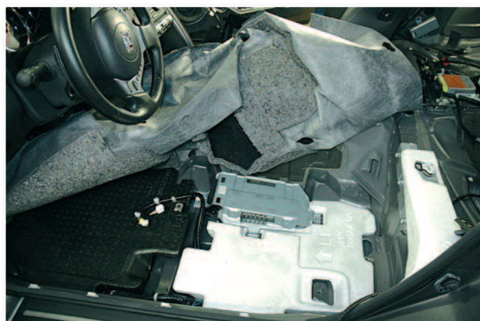
Sous la moquette, on peut apercevoir l'amplificateur d'origine.