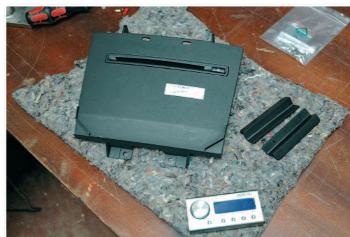
Voici la console qui accueillera l'afficheur du processeur.