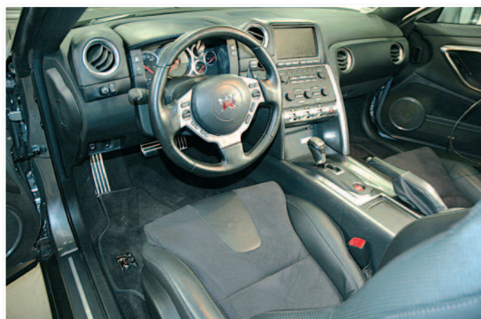
Voici l'habitacle de la GT-R, avec sa console centrale d'un seul tenant et son grand écran multifonctions.

Pour faire fonctionner l'installation, il est impératif de passer par un processeur car il est impossible de retirer l'autoradio d'origine qui pilote également bien d'autres fonctionnalités. Voici la marche à suivre.