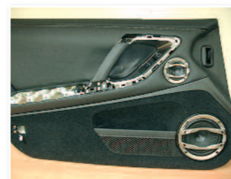
Panneau terminé avec le médium et le woofer fixés.