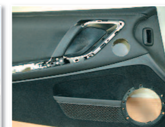
Et voici le panneau percé.