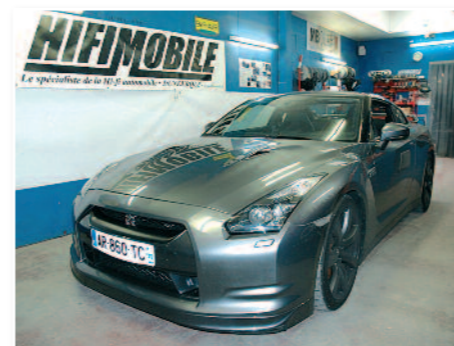
La bête « full stock », avant même le covering intégral blanc et capot carbone !