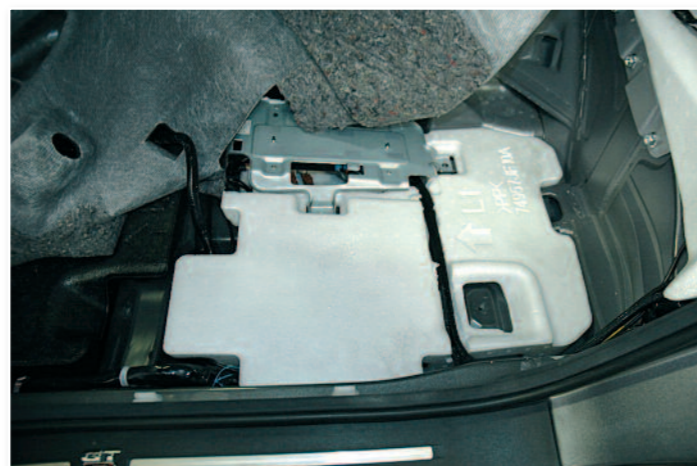
Câblage et mise en place du processeur sous la moquette.