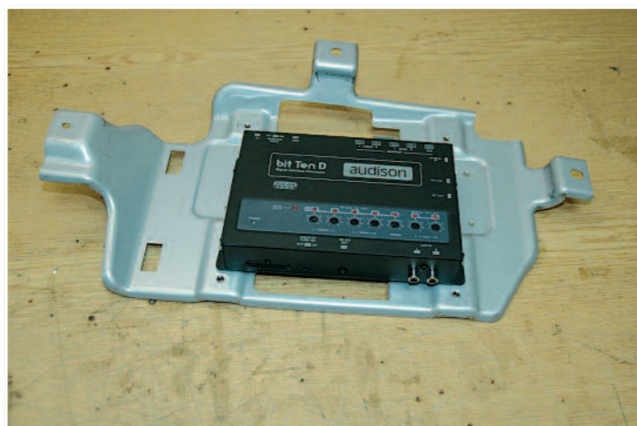
Démontage de l'ampli que l'on remplace par le fameux processeur.