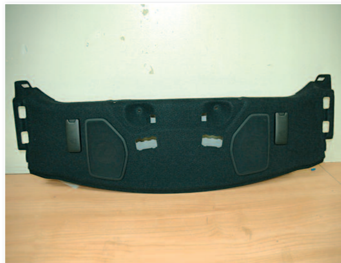
On démonte aussi la plage arrière...