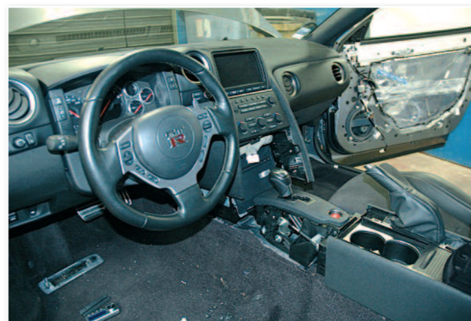
Démontage de la console sous l'autoradio.