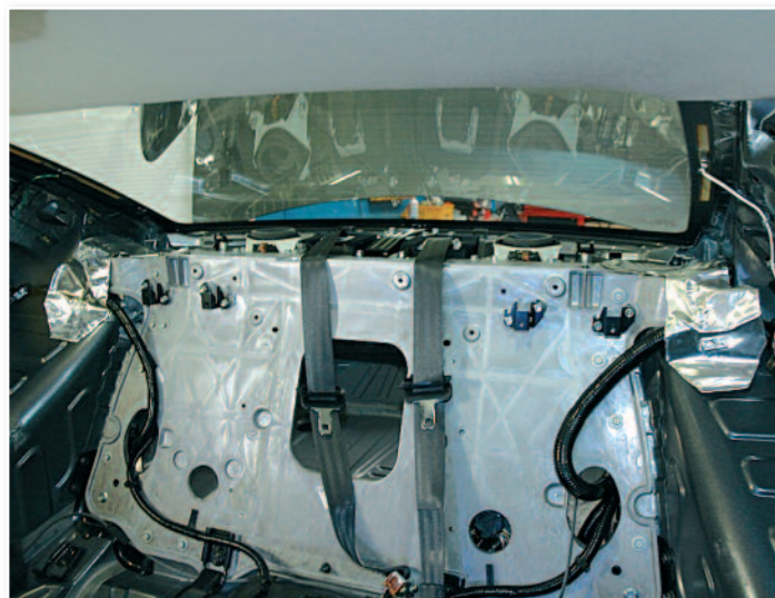
Le voici démonté.