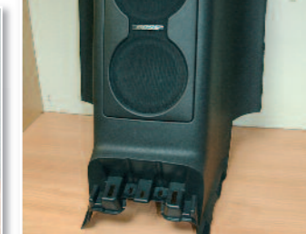
Voilà le support de caisson Bose.