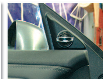
Fixation du tweeter sur son support.