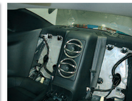
Et voici les HP arrière posés et câblés.