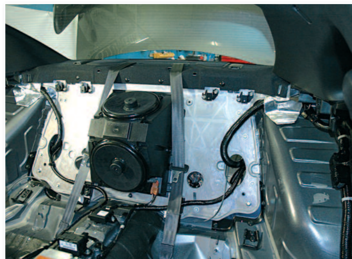
Après le démontage de la banquette arrière, on voit réellement la forme étrange du caisson d'origine...