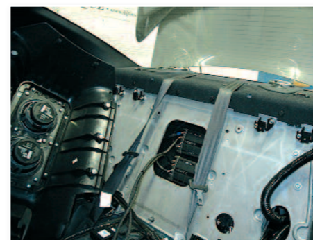
Câblage et mise en place du support de woofers.