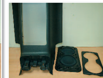
Démontage du support.