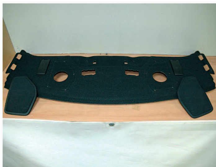
Et les grilles de HP d'origine.