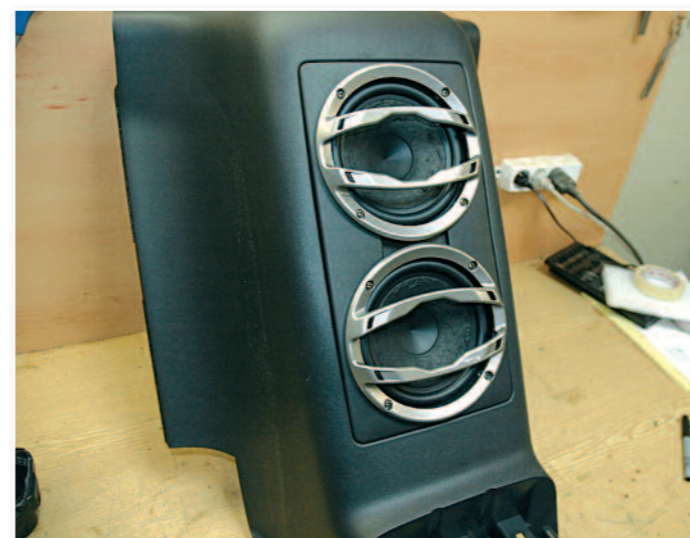
Voici les woofers à leur place, sans dénaturer l'emplacement du caisson !