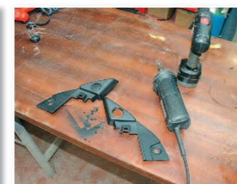
Démontage et découpe des supports de tweeters.