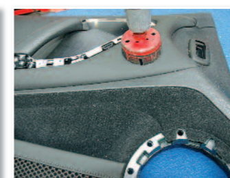
Perçage d'un trou pour l'emplacement du médium de 8 cm.