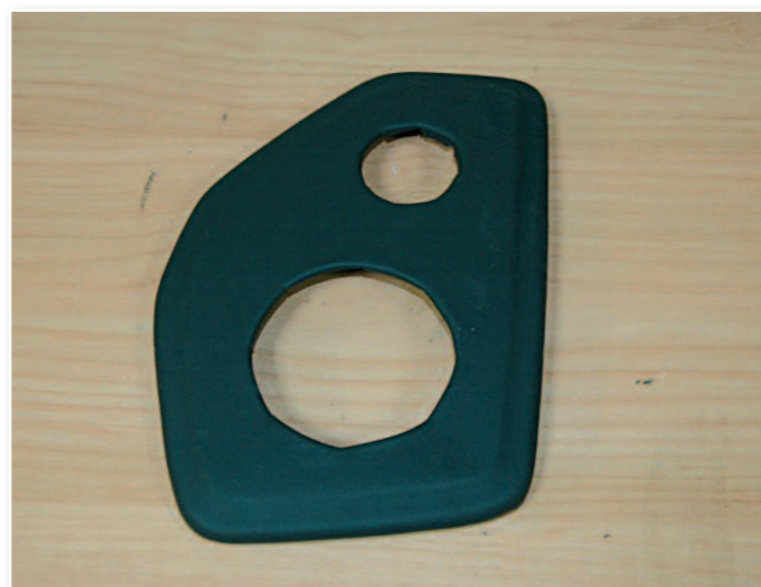
Fabrication de support garni de cuir pour le médium aigus en plage arrière.