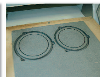
Fabrication de cales pour les nouveaux HP.