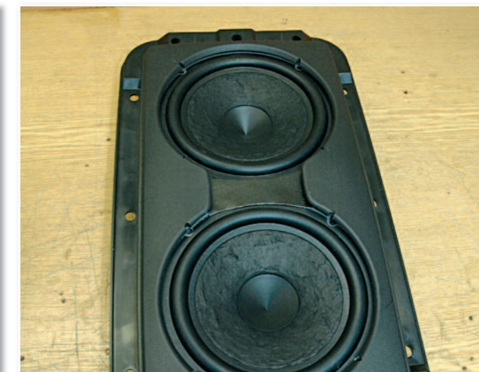
Fixation des woofers sur le support.