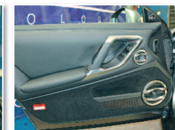
Voici la porte terminée, avec son beau kit 3 voies parfaitement intégré !