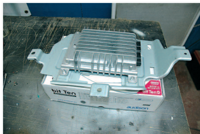
Voici l'amplificateur d'origine Bose.