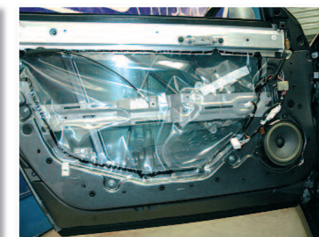
Démontage des panneaux de portes...