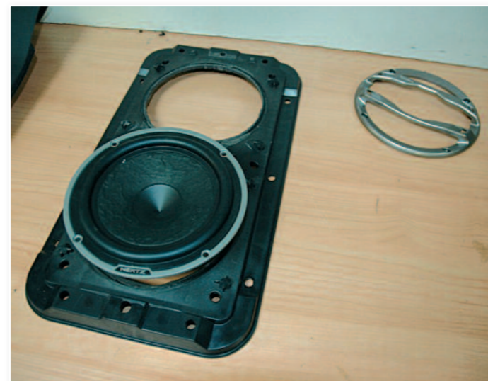
Découpe du support pour accueillir les woofers du deuxième kit 3 voies.