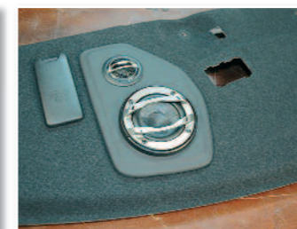
Puis sur la plage arrière.