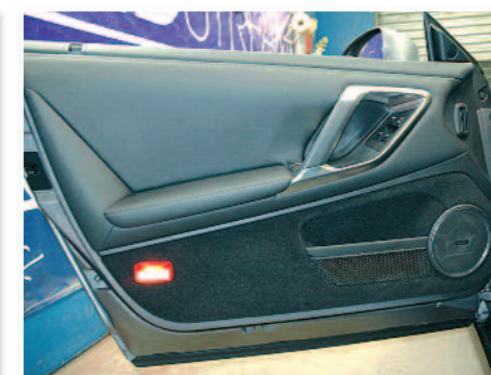
Voici les portes dans leur configuration d'origine.