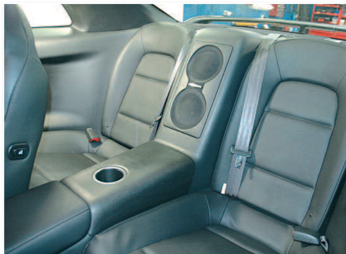
Voici les places arrière avec le caisson Bose d'origine au centre, caché derrière les deux grilles des « faux » woofers.

Les modifications s'avèrent ici nettement plus importantes qu'à l'avant. D'abord, on s'aperçoit que le caisson central d'origine est placé derrière deux grilles factices puisque les subwoofers du caisson sont placés complètement différemment. Du coup, la grille d'origine va idéalement servir à placer les woofers du kit éclaté 3 voies, avec derrière les filtres à la place du caisson d'origine (le nouveau caisson trouvera davantage sa place dans le coffre !). Le médium et le tweeter vont quant à eux se positionner sur la plage arrière, à la place des « petits » coaxiaux d'origine.