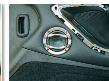
Mise en place du médium.