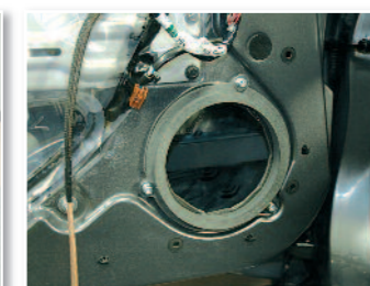
Fixation des cales sur les portes.