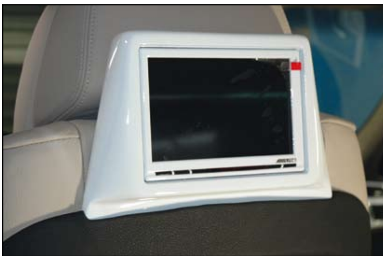
La fixation étant derrière la garniture de siège, le système reste parfaitement amovible sans laisser de trace pour une revente ultérieure du véhicule. Une fois tout remonté, l'écran est clipsé dans son support.