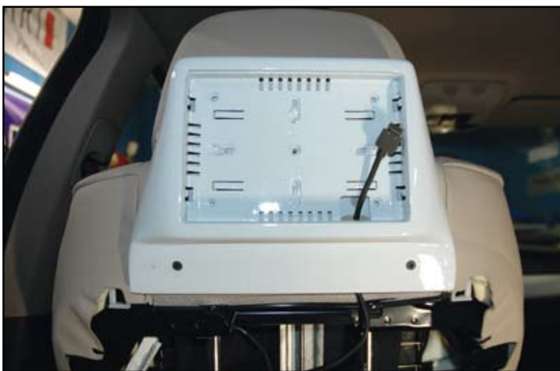
Le dossier du siège est démonté, pour fixer le support et passer les câbles audio/vidéo de l'écran.