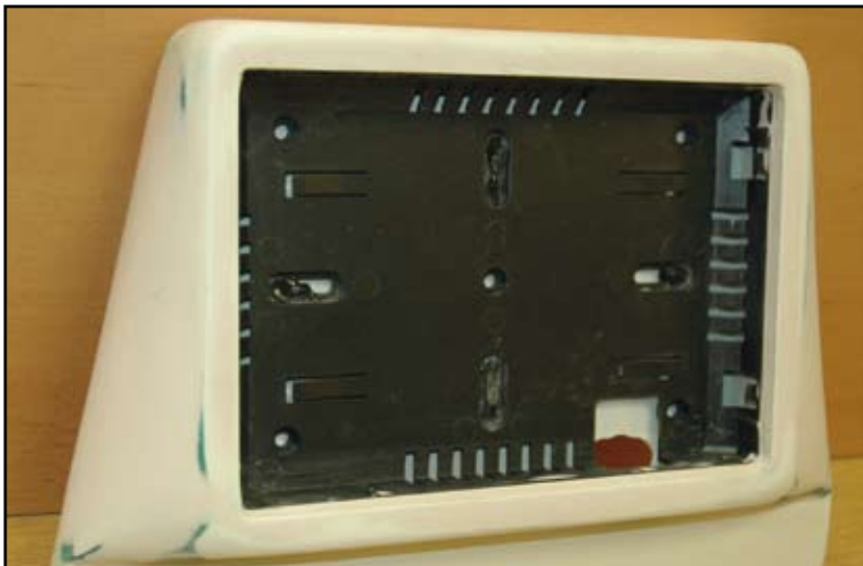
Une fois la forme désirée obtenue, elle est affinée avec du mastic de finition pour avoir une surface bien lisse.