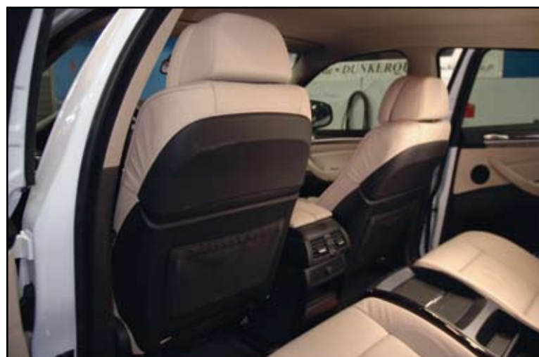
Lorsque les appui-têtes sont actifs, on ne peut ni les modifier, ni les remplacer par des modèles dits universels avec système vidéo intégré.

mais ce problème se rencontre aussi sur des voitures milieu de gamme. Bien sûr, il y a la solution de l'écran plafonnier, mais cela oblige tous les passagers arrière à regarder le même film. Hifimobile nous montre ici, comment ajouter un système vidéo dans chaque siège avant, sans toucher à l'appui-tête d'origine et en respectant le design de l'habitacle. Bien sûr, une telle opération est plus l'affaire d'un spécialiste du car audio que d'un amateur, et donc est plus coûteuse, mais c'est tout de même autre chose que les vulgaires systèmes à sangle que l'on trouve pour 3 Francs 6 sous dans la grande distribution. Dans le cas de cette installation, ce sont deux écrans de 7 pouces Alpine qui ont été choisis. Ils sont reliés à la source du X6 pour diffuser la vidéo.