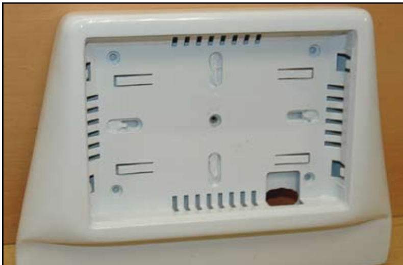
La pièce est ensuite recouverte d'apprêt, puis peinte dans le même blanc que la carrosserie du X6. Hifimobile aurait aussi pu faire un habillage cuir, mais à la demande du client, il a fait les pièces couleur carrosserie.