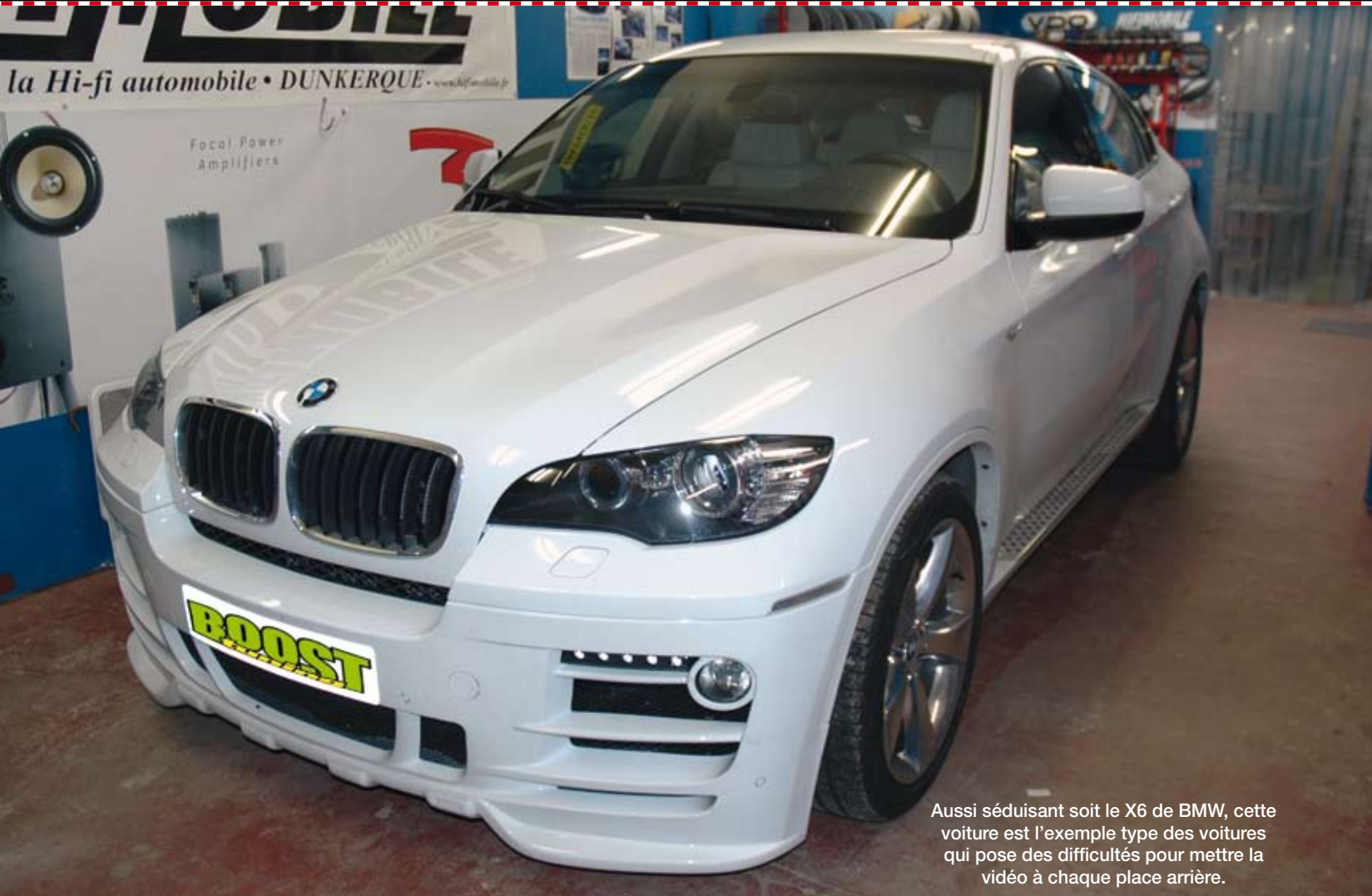
Aussi séduisant soit le X6 de BMW, cette voiture est l'exemple type des voitures qui pose des difficultés pour mettre la vidéo à chaque place arrière.