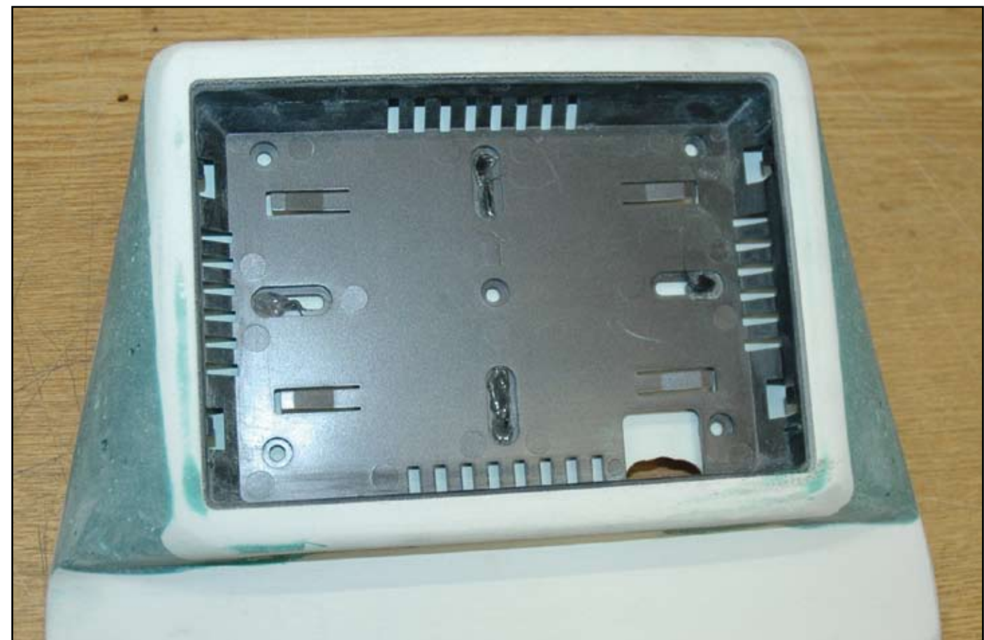
A l'aide de fibre et de mastic, Hifimobile réalise une forme harmonieuse au support. Ça paraît simple comme ça, mais cela demande un gros travail de ponçage et de masticage.