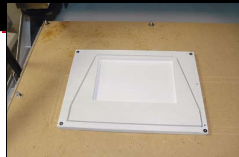
Un support est confectionné et découpé dans du Komacel de 16 mm. Ce matériau plastique se travaille très facilement, aussi bien pour le vissage et que pour le formage.