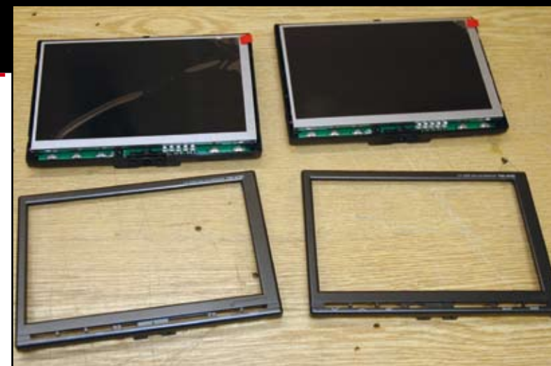
Les écrans Alpine sont démontés. Leur coque va servir de gabarit pour réaliser le support des écrans. De plus, elles seront ensuite peintes dans la même couleur que les supports.